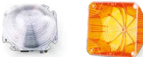
Difusor interno y calota con estriado especial para un efecto de señalización a 360° óptimo