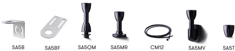
SA5B SA5BF SA5QM SA5MR CM12 SA5MV SA5T