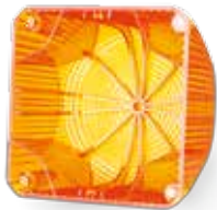
Difusor interno y calota con estriado especial para un efecto de señalización a 360° óptimo